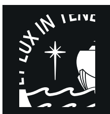
Detalle de la estrella blanca y cielo oscuro